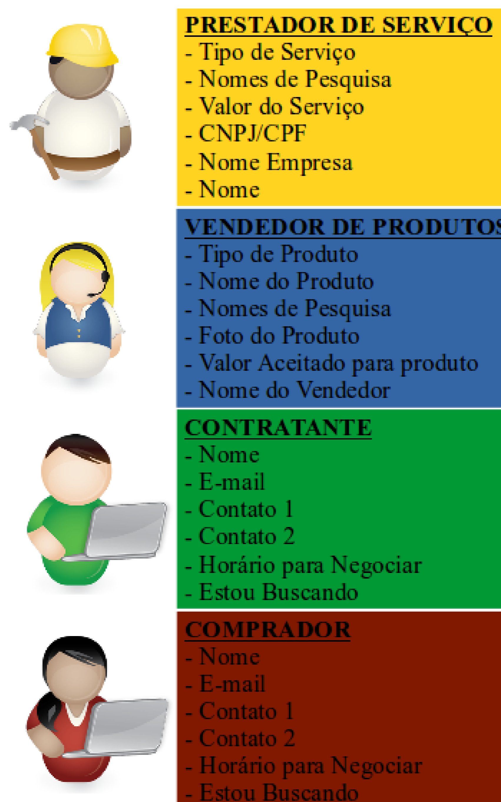
Figura1: Atributos das Entidades da transação

Durante a elaboração do projeto foi efetuado a separação e desenvolvimento das entidades e relacionamentos como mostra Figura1 e respectivamente Figura2 a seguir: